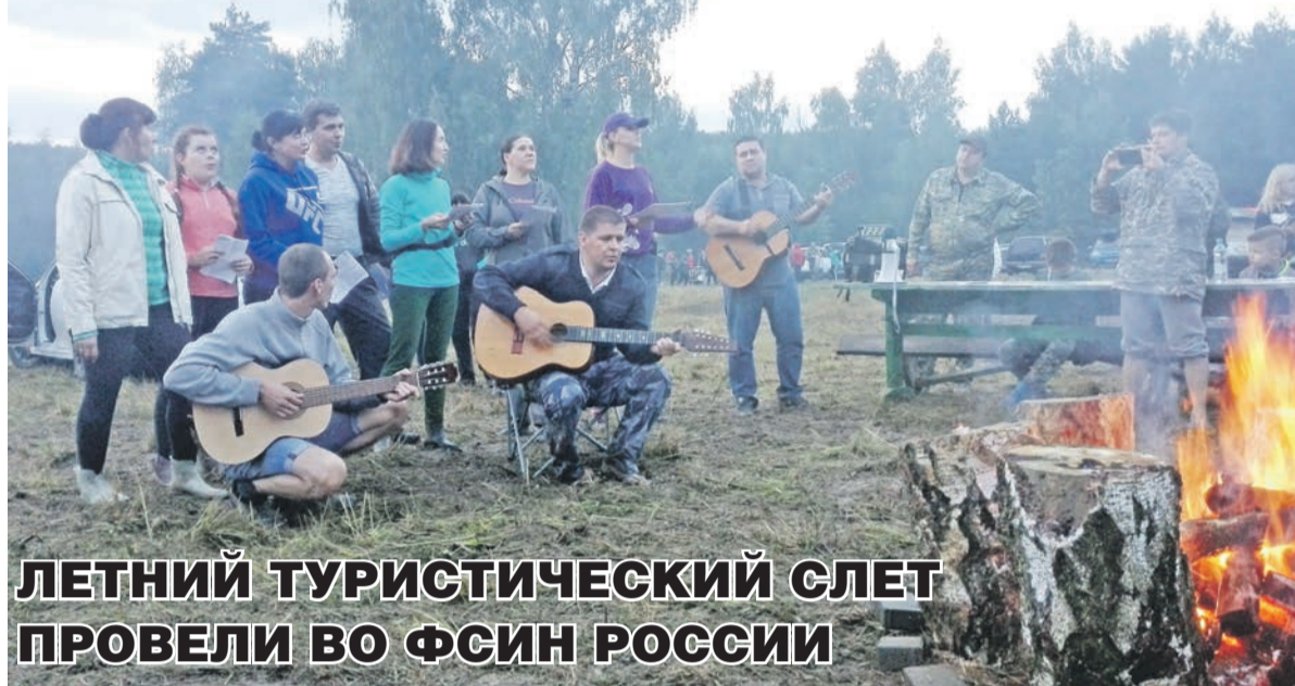
ЛЕТНИЙ ТУРИСТИЧЕСКИЙ СЛЕТ ПРОВЕЛИ ВО ФСИН РОССИИ

Первое место заслуженно досталось команде УФСИН России по